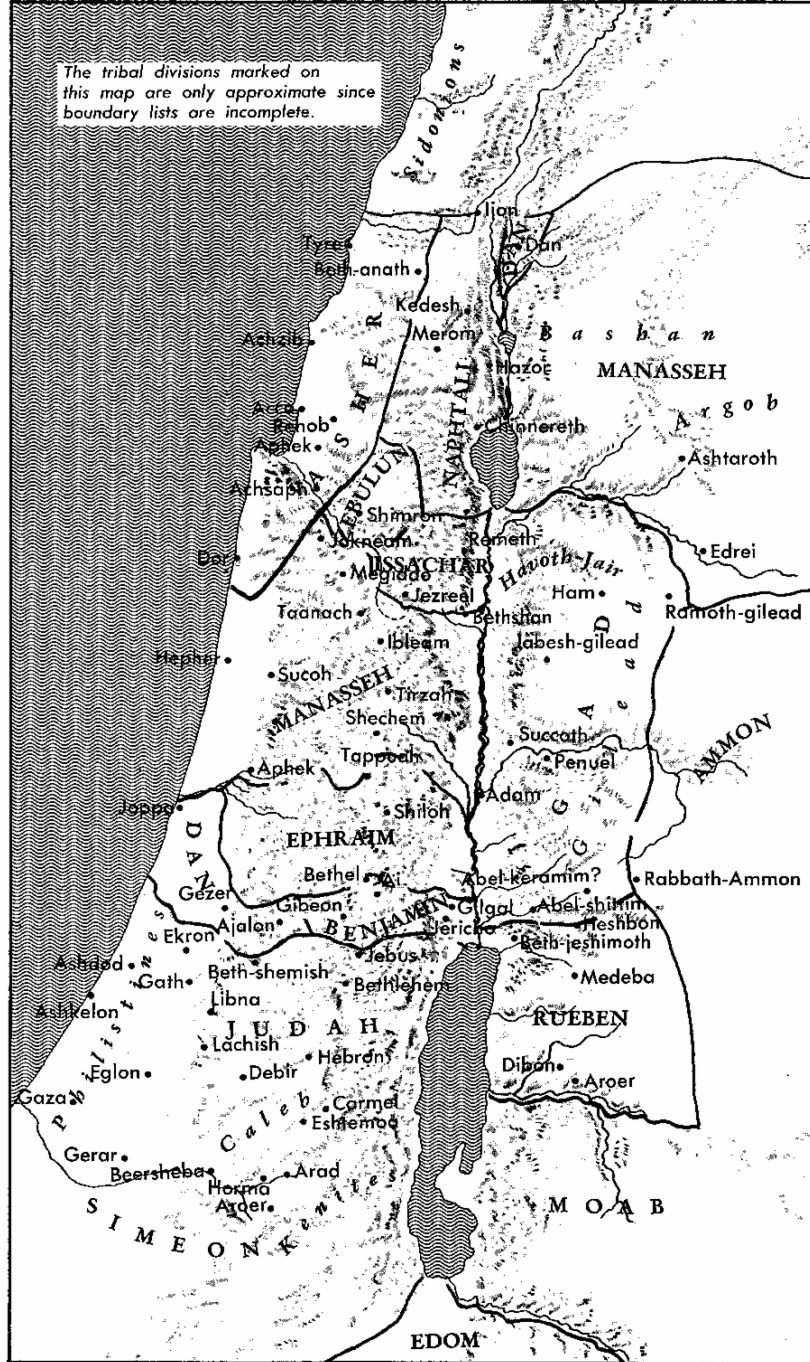
Map 6. The Tribal Divisions

24:29-33. இப்பகுதி யோசுவாவின் புத்தகத்தைத் தொகுத்து வெளியிட்டவர் எழுதிய பிற்சேர்க்கையாக உள்ளது. இதில் மூன்று மனிதர்களுடைய அடக்க விபரம் உள்ளது.