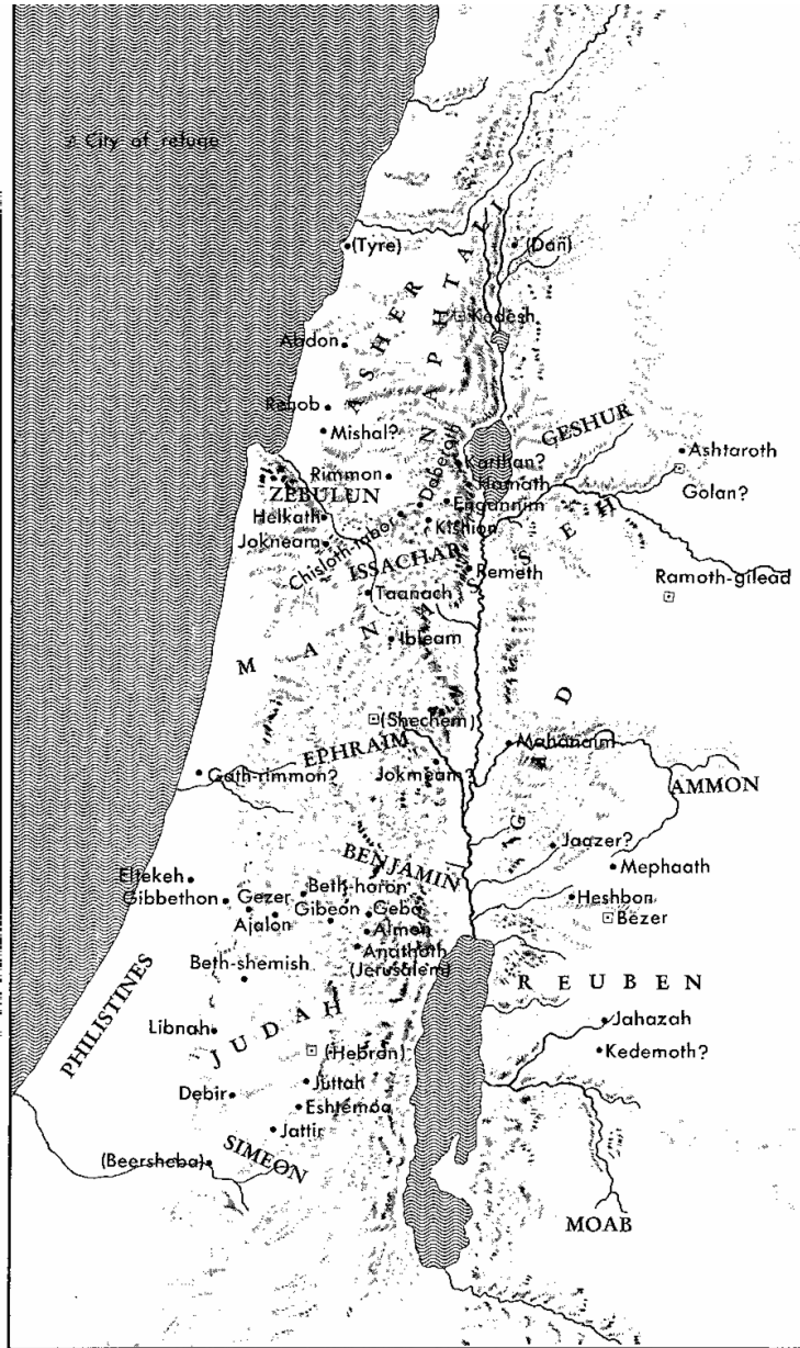
Map. 7. The Levitical Cities

21:1-42. லேவியர்கள் குடியிருப்பதற்கான பட்டணங்கள் கொடுக்கப்பட்டன. இதுபற்றி மோசே ஏற்கனவே அறிவுறுத்தல்கள் கொடுத்திருந்தார் (எண்.35:1-8). இதன்படி லேவியர்களுக்கு 48 பட்டணங்கள் கொடுக்கப்பட்டன (21:42).