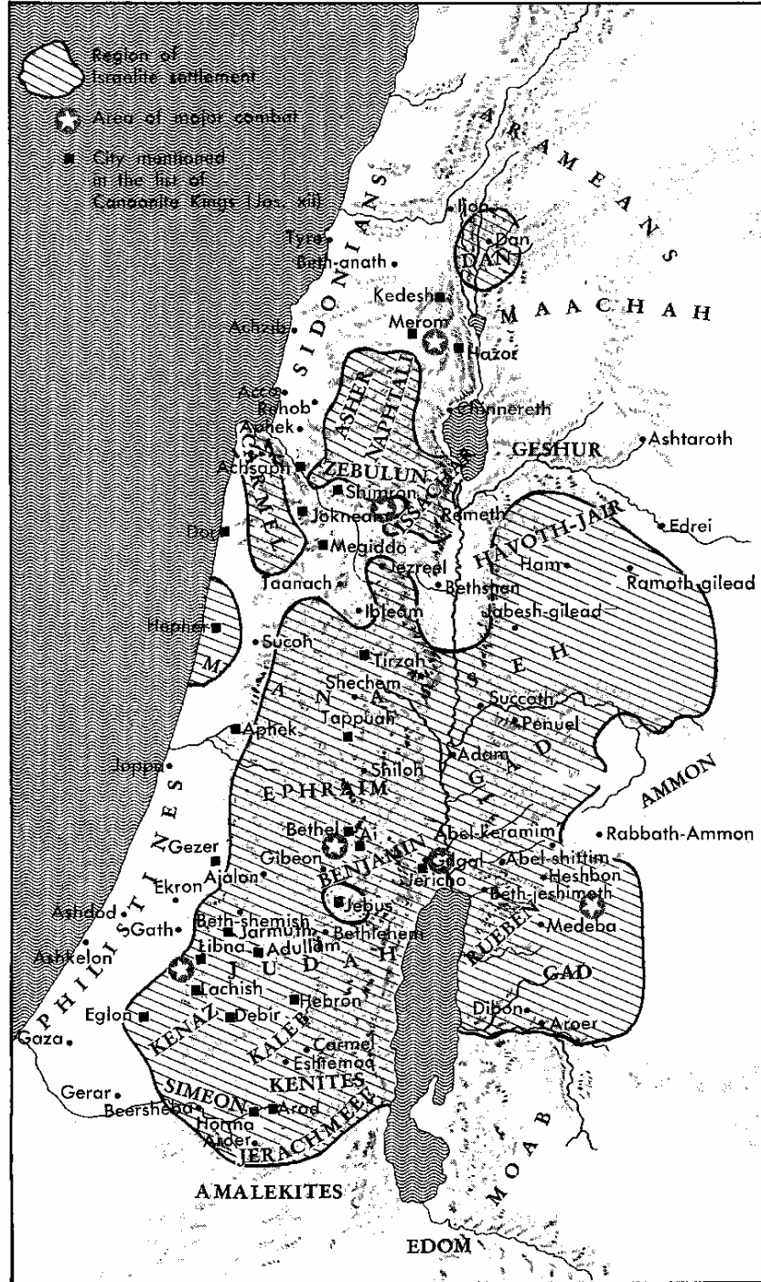
Map 8. Area Actually Settled by Israelites

1:43-45. தேசம் பங்கிட்டப்பட விபரங்களை எழுதிய பின்னர், ஒரு முடிவுரையாக இவ்வசங்கள் உள்ளன. இதில், தேவன் தாம் கொடுத்த வாக்குத்தத்தத்திற்கு உண்மையுள்ளவராயிருந்துள்ளது சுட்டிக்காட்டப்பட்டுள்ளது. எனினும், இச்சந்தர்ப்பத்தில் தேவன் அபிரகாமுக்கு வாக்களித்த முழு பிரதேசமும் (ஆதி.15:18-21) இஸ்ரவேலருக்கு கொடுக்கப்பட்டவில்லை. பிற்காலத்தில் இஸ்ரவேல் மக்கள் இவற்றைச் சுதந்தரித்தனர். (ஆமோ.9:14-15). ஆனால், இங்கு எண்ணாகமம் 34ம் அதிகாரத்தில் குறிப்பிடப்பட்டுள்ள பிரதேசங்களையே இஸ்ரவேல் மக்கள் சுதந்தரித்தனர்.